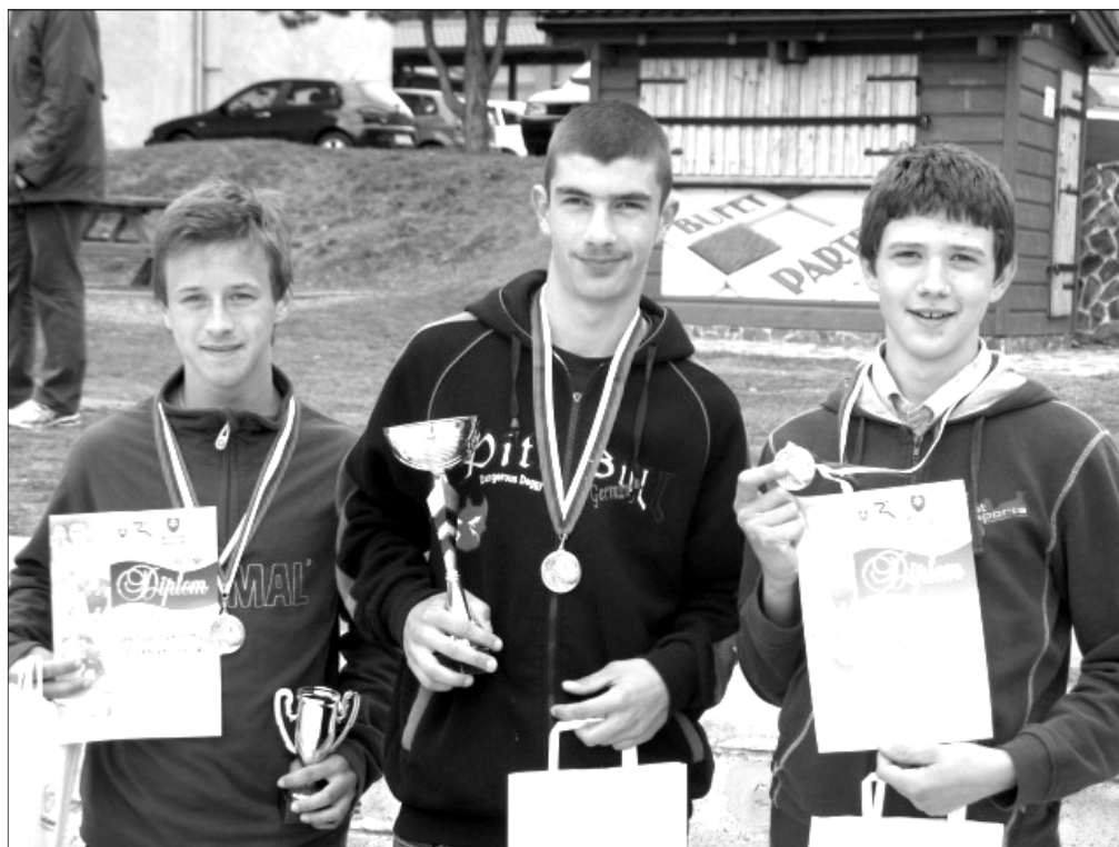
m Víťazi Janova Lehota

Super atmosféru gradovali bezplatné sprievodné akcie ako jazda na koni, maľovanie