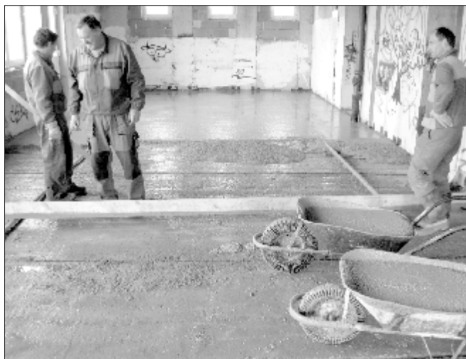
m Betonovanie podláh na stavbe pri OÚ

Na jar a v mesiaci október sme aspoň čiastočne poopravovali výtlky na našich cestách. V Lovčici sme vyložili cca 30 m kanála a svah sme spevnili zatravnovacími panelmi. Vymenilo sa 300 m samonosného kábla na miestnom rozhlase. Po dohode s Povodím Hrona sa potoky v Lovčici a v Trubíne dali vyčistiť a doplnili sa chýbajúce betónové panely.